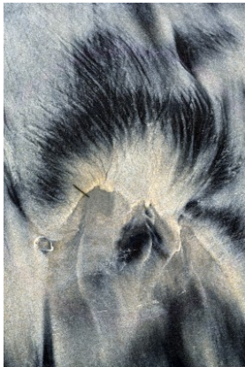
Traces sur le sable laissées par le ressac

Toutes les colorations existent à l'état natif, mais les techniques photographiques permettent de les révéler et de les sublimer.