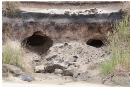
Grottes apparues en 2018 au niveau de la plage des chiens à euronat.